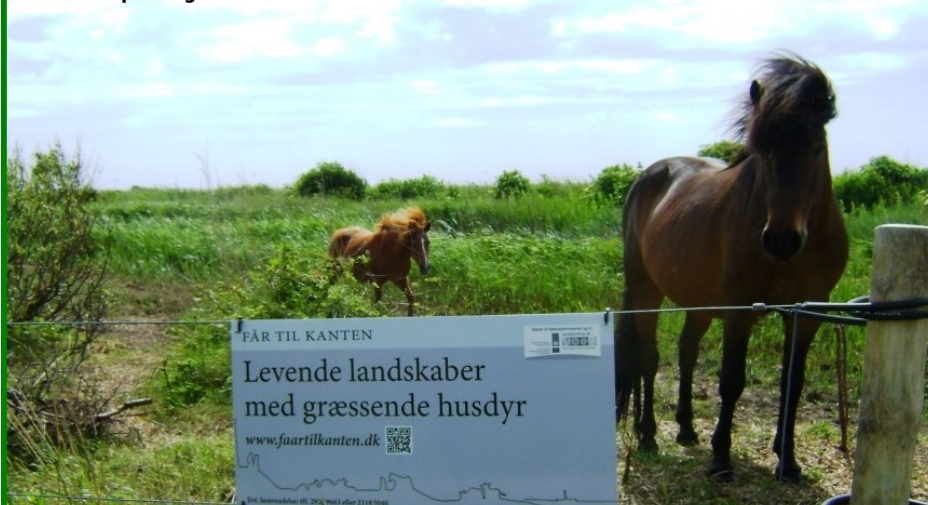
Islændere på Tangen